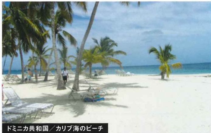
ドミニカ共和国／カリブ海のビーチ