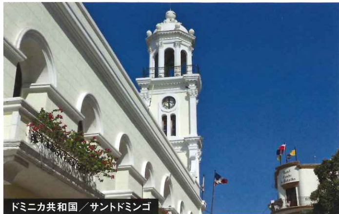
ドミニカ共和国／サントドミンゴ

の事前キャンプを受け入れ、市民のみなさまと一体となっておもてなしを実施し交流を図ることを目指しています。 みなさん、2020年東京オリンピック・パラリンピック競技大会のホストタウンとしてドミニカ共和国を応援していきましょう!!