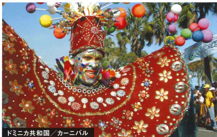
ドミニカ共和国／カーニバル